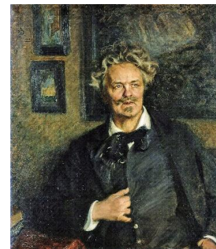
(August Strindberg, Portrait av Richard Bergh)

heter " Vexilla regis prodeunt " av Venantius Fortunatus. I vers sex i denna hymn finner vi den klara och koncentrerade innebörden av korset, som August Strindberg säkerligen klamrade sig fast vid efter ett intensivt liv, fyllt av många nederlag och mycket umbäranden: " O Crux ave, spes unica, hoc Passionis tempore, piis adauge gratiam, reisque dele crimina. " Det betyder ungefär så här: " Hell dig kors, vårt enda hopp, i denna tid full av sorg och passion, ge ännu mer nåd till alla som tror, och ta bort de skyldigas synd. " Detta är den bön jag också ber, och detta är det hopp jag sätter min tillit till.